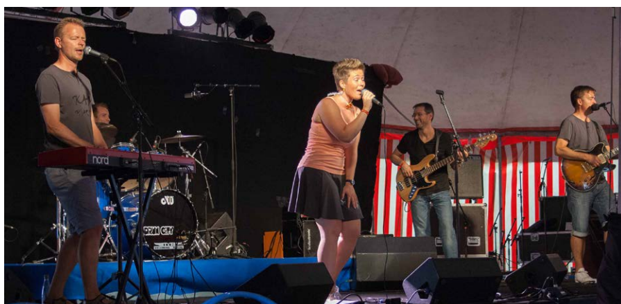
Bandet Kamikarse spiller dansemusik efter middagen.